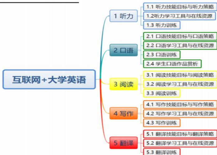
图 2：《互联网+大学英语》慕课教学大纲