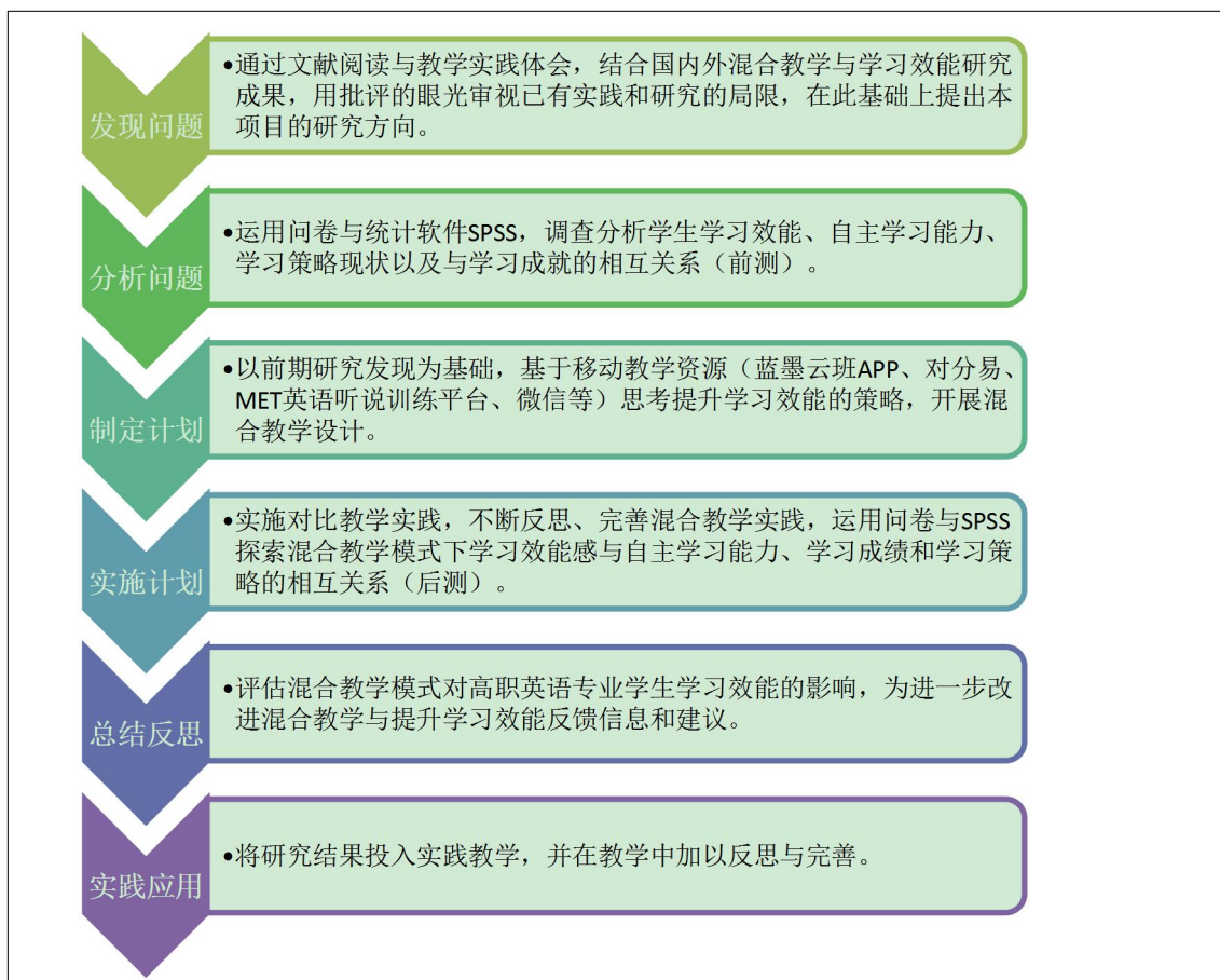
图 3：项目研究基本思路流程图